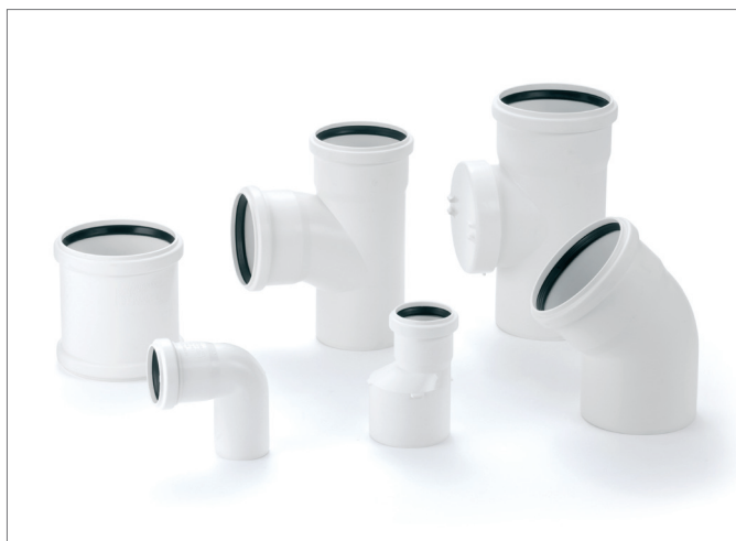
RAUPIANO Plus conține un program bogat de accesorii pentru susținerea modalităților diverse de instalare